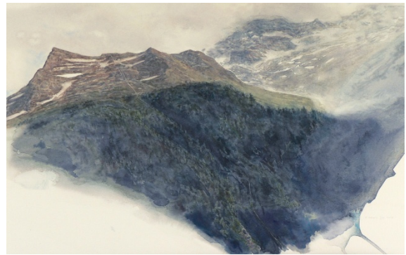
En été : contrastes violents, instantanés atmosphériques

A l'automne : la gamme complète des fauves, des violets et des terres