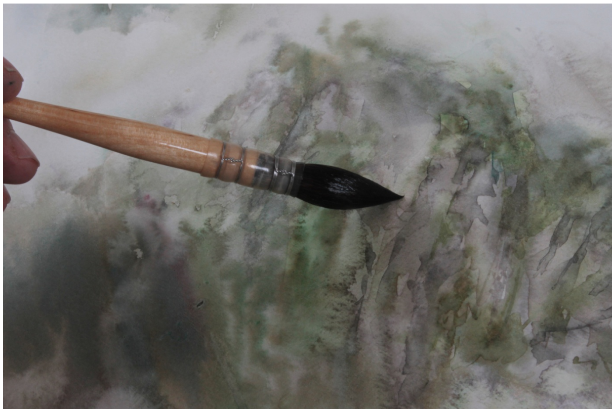
Le pinceau à lavis en action

Les pigments : Winsor et Newton, en tubes : jaune transparent, rose permanent, bleu Winsor tendance verte, terre d'ombre naturelle, vert Winsor tendance bleue, violet Winsor, rouge cadmium et marron de pérylène.